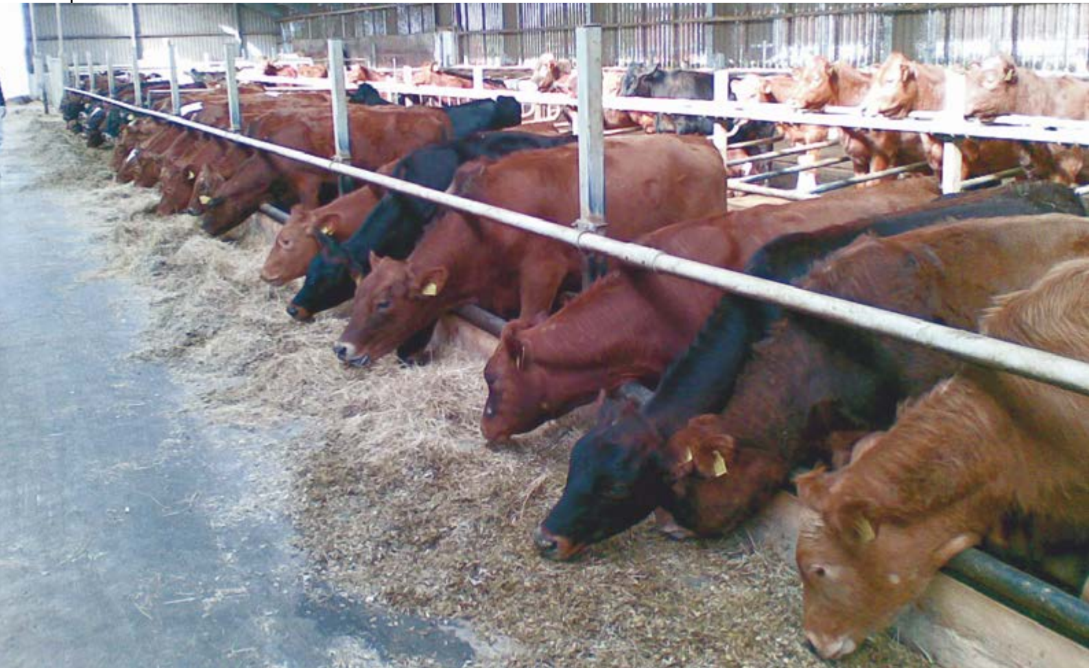
Stalla con tipici esemplari di razza rosse danesi.

Indispensabile nella stalla di oggi per esserci domani.