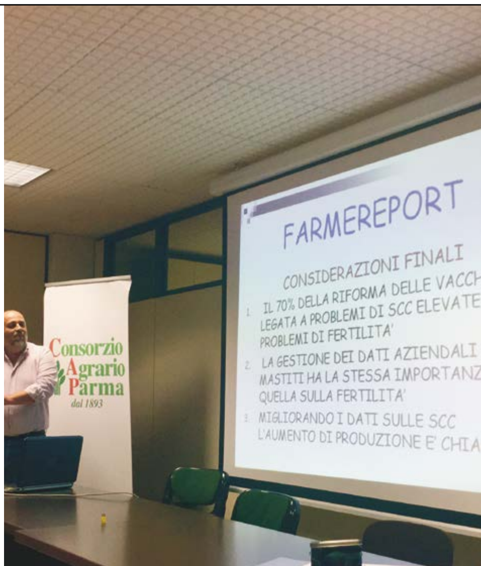
Momenti della presentazione del nuovo software FARMERREPORT.

1. Gestione aziendale con elaborati riguardanti produzione totale media, qualità latte, lunghezza lattazione, parto-concepimento, qualità latte massa ecc.