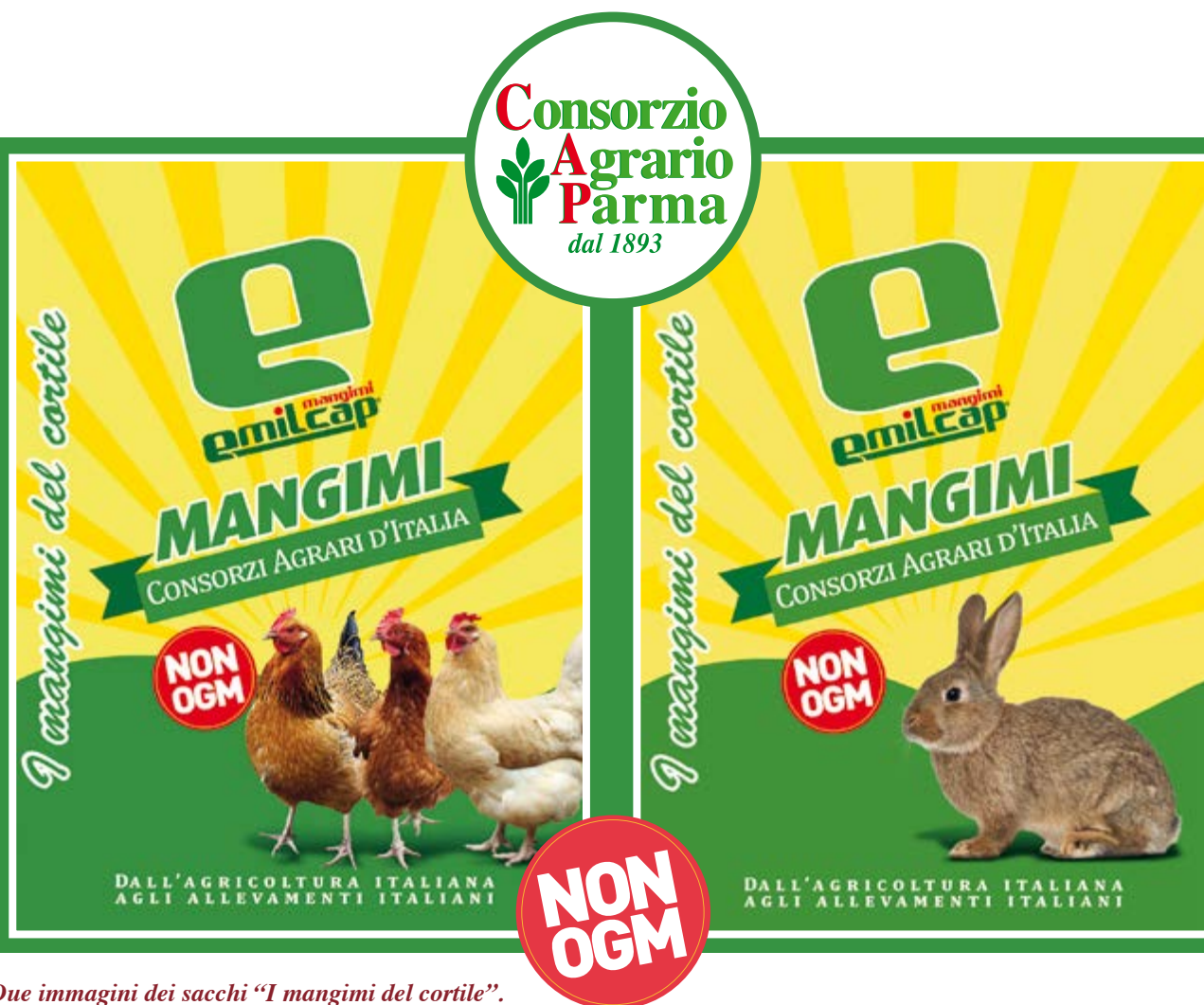
Due immagini dei sacchi “I mangimi del cortile”.

A partire da giugno 2015 il mangimificio Emilcap con sede al Cornocchio (Parma), ha definitivamente imboccato la strada della produzione di mangimi composti da materie prime non geneticamente modificate e quindi con mais e soia di produzione nazionale, visto che l'Italia, come forse tutti non sanno, ha definitivamente vietato la coltivazione di organismi modificati.