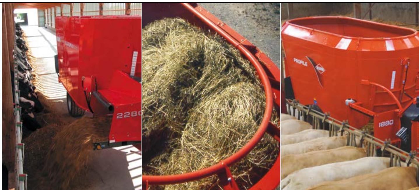
Carro miscelatore Kuhn Euromix I-1880.

gamma di carri miscelatori capace di distinguersi sul mercato, offrendo le migliori prestazioni in termini di taglio, velocità ed uniformità di miscelazione.