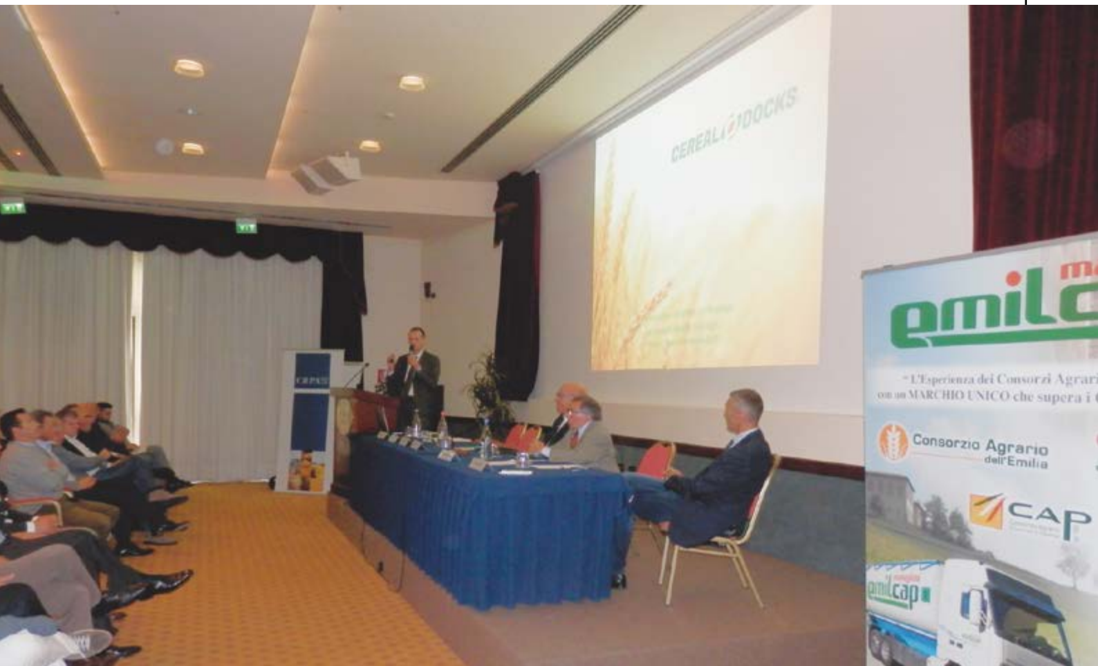
Un momento del convegno tenutosi a Reggio Emilia.

La dipendenza dall'uso di alimenti zootecnici di provenienza estera può mettere a rischio il mercato dei prodotti zootecnici della tradizione emiliano-romagnola per vari motivi, principalmente legati a volte al costo mentre altre volte alla sicurezza delle forniture.