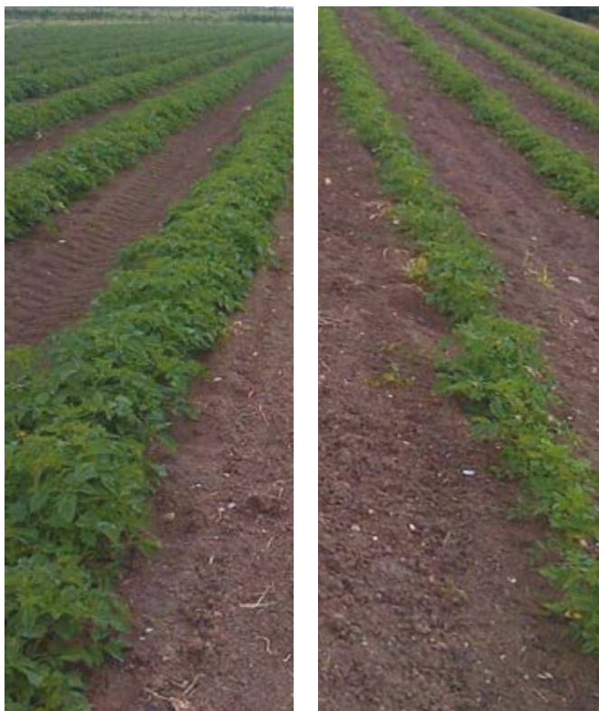
A sinistra concime organo minerale con acidi umici a confronto con concime chimico a destra.

Lo staff del Consorzio Agrario di Parma è al fianco degli agricoltori nella ricerca e sviluppo di soluzioni per le varie necessità che possono prospettarsi.